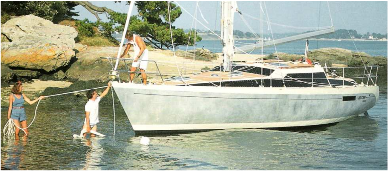
Vulcain Transat 11,15 x 3,85 m bisafan 1984 Une première version du Vulcain Transat, à jupe plus courte, en acier, s'est appelée Vulcain Marco Polo